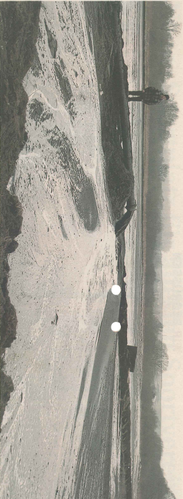
Das Spülfeld am Klöterpottsweg wirkt wie eine Mondlandschaft. Doch gleich versiegt der Quell. Die Entschlammung des Tollensekanals ist zunächst beendet.